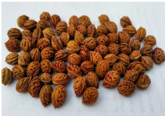
1-rasm. Shaftoli danagi

Efir moylarini ajratib olishda suv-bug'li distillyatsiya eng keng qo'llaniladigan an'anaviy usullardan biri hisoblanadi, chunki u texnologik jihatdan nisbatan sodda, amaliy jihatdan ishonchli va sanoatda moslashuvchan usuldir [7, B.8]. Biroq shaftoli danagidan ajratib olinadigan uchuvchan komponentlar va ularning miqdoriy ko'rsatkichlari bo'yicha ma'lumotlar cheklangan. Ayniqsa, ularni farmakopeya talablari asosida standartlashtirilgan usullarda baholash yetarli darajada yoritilmagan [4, B.7].