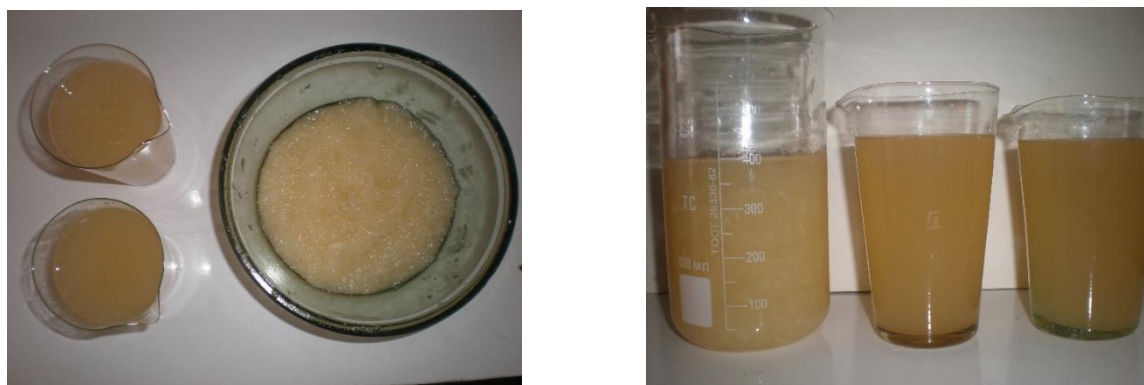
1-rasm. “Ko‘cha” va “Kamir” navli qovun eti va sharbati.

Tadqiqot obyekti sifatida Toshkent kimyo-texnologiya instituti tomonidan taqdim etilgan “Ko‘cha” va “Kamir” navli qovunlardan olingan sharbat namunalari tanlab olindi. Namuna olish jarayoni sanitariya-gigiyena qoidalariga muvofiq amalga oshirilib, tashqi ifloslanishlarning oldini olish maqsadida steril idishlardan foydalanildi. Har bir nav bo‘yicha alohida namuna tayyorlanib, laboratoriya sharoitida tahlil qilindi.