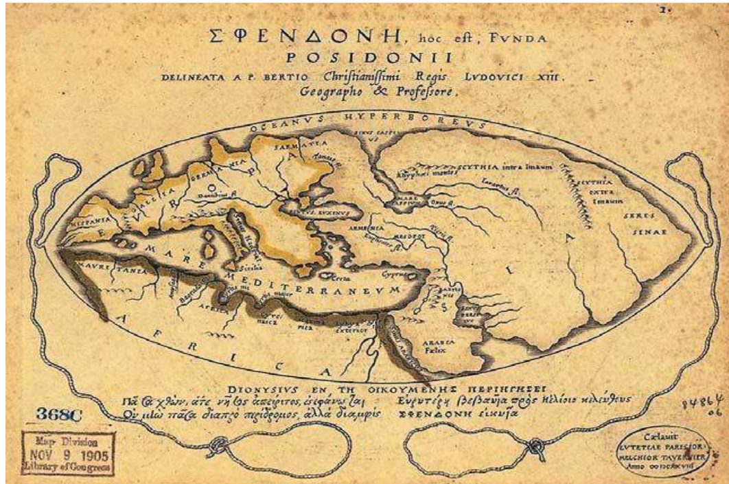
6-расм. Посидония Ойкуменаси. Пьера Бертъе ва Мельхиора Тавернье реконструкцияси [9, Б.12.].

Агафемер эса Геродотгача яшаган Милетлик Анаксимандр ойкуменани харитага илк маротиба киритган , деб ҳисоблайди. Милетлик Гекатей эса ушбу харитани такомиллаштирган, “ойкумена” тушунчасини эса фалсафадаги анахронизм йўналиши ишлатган,[8] дейилади.