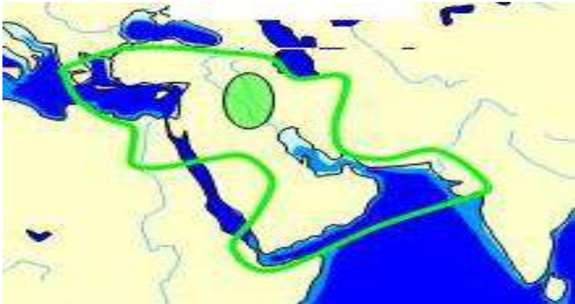
4-расм. Мил.авв. III-II минг йилликдаги ойкумена (месопатамия манбаларига кўра)

Қадимги юнон тарихчиси Геродот (мил.авв.V асрда) “Тарих” асарида (3-китоб, 114-қисмида): χώρα ἐσχάτη τῶν οἰκουμένων χωρῶν – “ўрнашган/жойлашилган давлатлардан энг узоқ (жойлашган) давлат” [5, Б.140.] тарзида таъриф берилган. Википедия – электрон энциклопедиясида “ойкумена” (οἰκουμένη) тушунчасини жўғрофий контекстда илк бора Геродот томонидан “ Тарих ” асарида келтирган [6], дейилади.