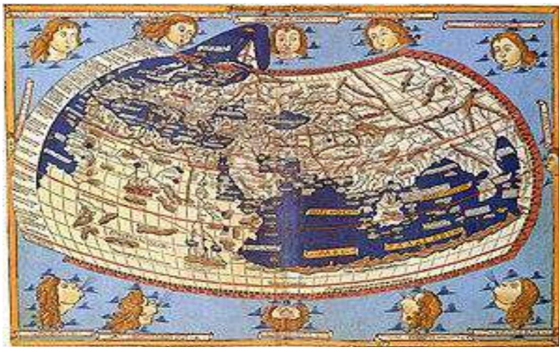
3-расм. XV асрда Ойкуменани тавсифловчи сурат. Бу Птолемейга таълуқли деб қаралади (1482 йилда Иоганн Шнитцер томонидан ишланган гравюра).

Милетлик Гекатей “ойкумена”га Европани (Шимолий Европадан ташқари), Кичик ва Олд Осиёни, Ҳиндистон ва Шимолий Африкани киритган [4].