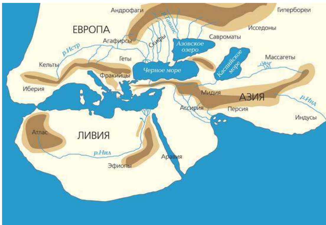
5-расм. Геродот ойкуменаси [7, Б.4.].

Қадимги юнон тарихчиси Геродот (мил.авв.V асрда) “Тарих” асарида (3-китоб, 114-қисмида): χώρα ἐσχάτη τῶν οἰκουμένων χωρῶν – “ўрнашган/жойлашилган давлатлардан энг узоқ (жойлашган) давлат” [5, Б.140.] тарзида таъриф берилган. Википедия – электрон энциклопедиясида “ойкумена” (οἰκουμένη) тушунчасини жўғрофий контекстда илк бора Геродот томонидан “ Тарих ” асарида келтирган [6], дейилади.