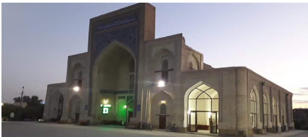
3-rasm. Buxorodagi Fayzobod xonaqosining kechki ko‘rinishi

Ushbu xonaqohlar ichida Fayzobod xonaqosining me‘moriy echimi ancha tantanavor bo‘lib, tashqi ko‘rinishi va rejaviy echimida barcha tarafdin vizual yaxlitlikka egadir. Binoning yon tarzlari bo‘ylab ishlangan ochiq ravoqlar galereyasi xovli ichidan go‘zal ko‘rinish hosil qilgan. Umuman xonaqoh hovlisi Buxoro iqlimi sharoitida yoqimli mikroiklim yaratish imkonini bergan. Bosh peshtoq va xonaqohning orqadagi zaliga bir qavatli hujralar birikkan. Alohida shakllangan xonaqoh binolari o‘zlarining salobatligi, inter‘er va ekster‘erlarining mahorat bilan ishlanganligi, tashqi ko‘rinishi va simmetrik kompozitsiyali arxitekturaviy obrazi bilan xonaqohlarning boshqa xillaridan alohida ajralib turgan (3-rasm).