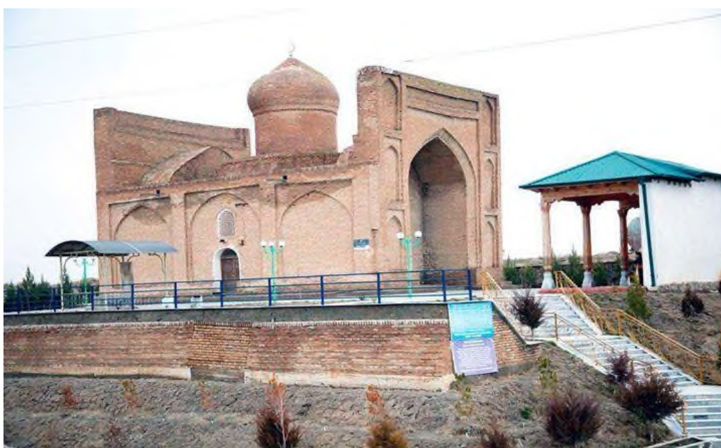
1-rasm. Samarqand bilan Buxoro shaharlarini o'zaro bog'lab turgan Buyuk Ipak yo'li ustida joylashgan Dobusiya qal'asi

Bo'ylama o'qli simmetrik kompozitsiya, shuningdek, Navoiy shahri yaqinidagi Dobusiya qal'asida XVI asrda qurilgan Imom Baxri xonaqosi va Buxoroga yaqin joylashgan Chorbakr ziyoratgohidagi xonaqohlarga ham xosdir(1-rasm).