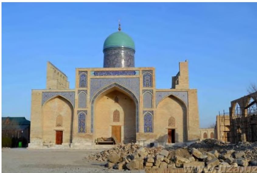
2-rasm. Karmanadagi “Qosim Shayx” majmuasi ta’irlash jarayonidan lavha

Alohida bino tarzida shakllangan peshtoqli – gumbazli ko‘pxonali xonaqoh binolari, odatda, bitta bosh kirish peshtog‘iga ega, biroq binoning bosh o‘qi yonida ikkita kirish peshtoqi joylashgan turi ham uchraydi. Ular o‘rtasida baland gardish ustiga o‘rnatilgan gumbaz joylashadi. O‘tmishda Navoiy va Ingichka shaharlari orasida joylashgan Dobusiya qal‘asidagi Imom Baxri xonaqosi (XVI a.), Karmanadagi Qosim – Shayx xonaqosi (XV a.) shunday xonaqohlarga misoldir. Qosim – Shayx xonaqosining yon tarzida uchinchi peshtoq ham mavjud bo‘lib, u tashqi ayvon vazifasini bajaradi. Bosh kirish peshtoqi, odatda, boshqa peshtoqlardan baland bo‘lib, uning tugal qismi ochiq ravoqlar qatori bilan bezatilgan. Ta’kidlash zarurki, tarhi mujassam simmetrik tarzli (yig‘noq) kompozitsiyali ko‘pchilik xonaqohlarda markaziy bosh ibodat zalining tarxi krest shakliga yoki unga yaqin bo‘lgan shakllarga ega bo‘lib, tarhi kvadrat shaklli zal ham uchraydi.