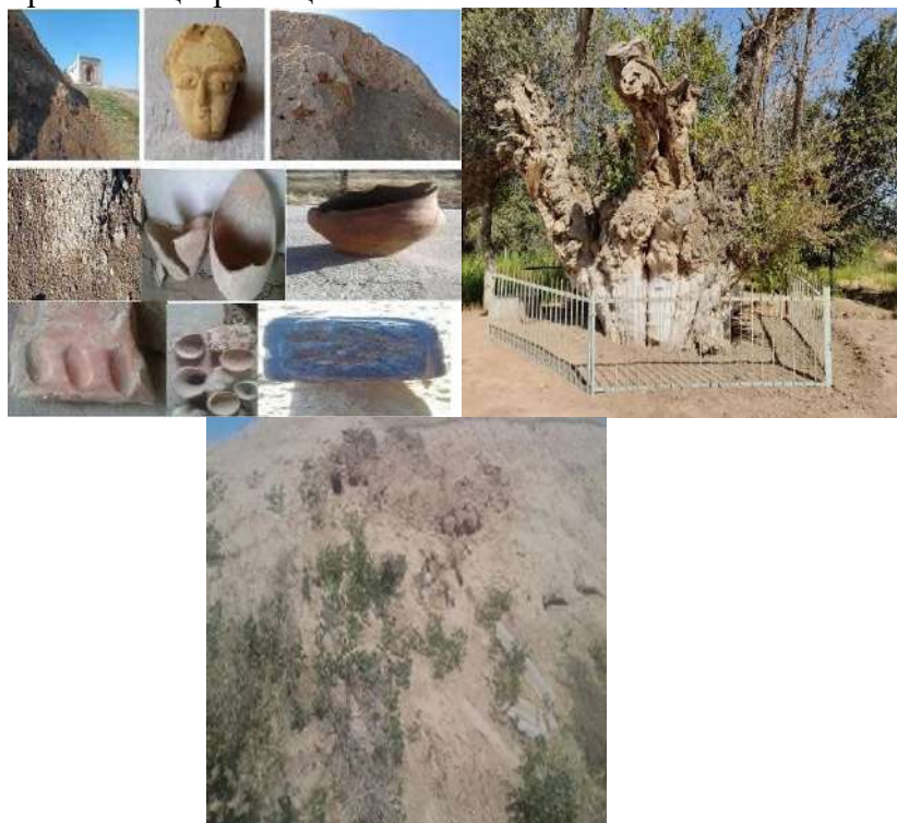
Суратда: кўҳна Хузор қавчин эли Чўғуртма қавми туркий олам авлодларига дахлдор қадимги улуг массагет-сак амирлари манзил шахристони Ҳожабош ота зиёратгоҳи.