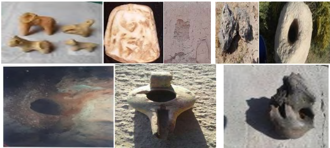
Суратларда Бекмантепа-эски сак тўралари анжуманлар манзилгоҳи қўрғон ҳожа мазорлари яйловга айланган манзил топилмалари юқорида тотеним санамлар, девор излари, самодан тушган кўк тош, қўрғон дарвозаси таянч тоши, хумдон, тутатқидон, жангчи чўқмор қуроли.

Бекмантепа қаршисида қадим оташпараст-зардуштийлар сақланиб қолган ёрти мозори унитилган авлиёлар ном-нишонсиз ётибди. Биргина ҳозирда очиқланмаган, ўрганилмаган рўйхатларда эндигина шаклланаётган етти қалъага тегишли мазорлар, яъни қадимда ҳар қўрғон ҳукмдори ҳоклари ўша жойнинг ўзида дафн этилганки, улар ҳозирги қабрлар остида қолган бўлса. Бу ҳудудда ётган етти пир авлиёлар, Оқтош-Кўктош-Ғарибота каби ўрганилмаган бузруквор манзиллардаги авлодларимиз не бир амиру туркистонлар, азиз авлиёлар ётганини англамайми? Ҳожа Размоз ва бошқа улуғлар номидаги мазорлар йўқ эмас, бор. Биргина қавчин эли эъзозлаган Ҳожабош ота қадим туркийлар ва Соҳибқирон Амир Темура номига қўйилган таҳқиқлар ортида очиқланмай қолганлиги ҳам бор гап.