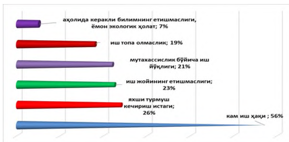
2-Diagramma. Mehnat migrantlarning xorijiy davlatlarga ishlash uchun ketishni asosiy omillarini o‘rganish maqsadida tuzilgan.