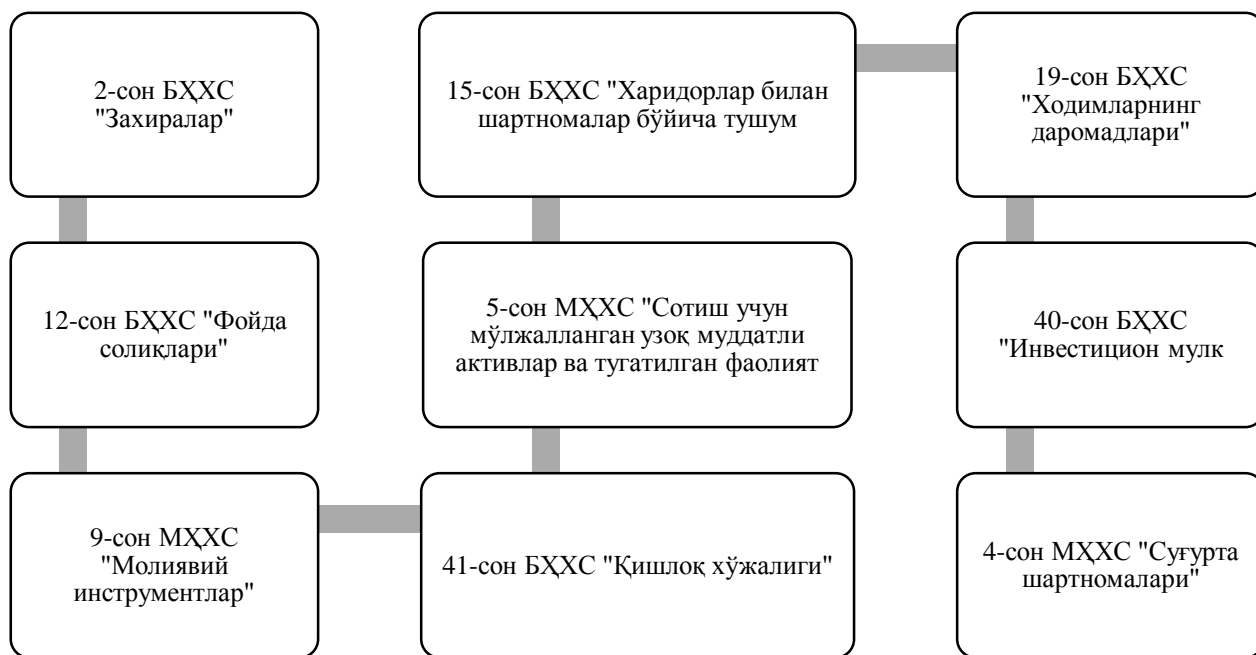
1-расм. Активларнинг қадрсизланиши стандартдан ташқари ўзининг меъёрий талабларидан келиб қадрсизланиш даражаларини ҳисобга олувчи бухгалтерия ҳисоби ва молиявий ҳисоботнинг халқаро стандартлари.

Мазкур расмда келтирилган халқаро стандартлар 36-сонли “Активларнинг қадрсизланиши” стандарти талабларига мос ҳолда эмас балки, активларни ўзига хос хусусиятларидан келиб чиқиб қадрсизланишга текшириб борилади.