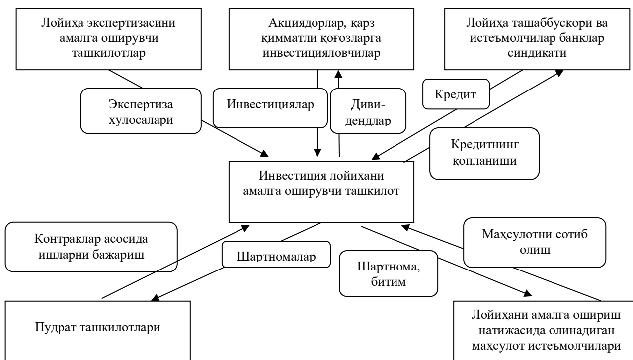
1-расм. Инвестиция лойиҳаларини синдикатли кредитлашнинг умумий схемаси [2].

Шу билан бирга иштирокчи банклар таркибига истеъмолчилар банклари билан бир қаторда инвестиция лойиҳасини амалга оширишдан манфаатдор барча томонлар бўлиши мақсадга мувофиқ. Синдикатли кредитлашда олинган кредитни қайтара олмаслик рискинни бартараф этиш мақсадида инвестиция лойиҳаси ташаббускори томонидан акциялар ёки акцияларга конвертация қилиниши мумкин бўлган бошқа турдаги қарз қимматли қоғозларини эркин савдо учун муомалага чиқариши ёки истеъмолчилар ўртасида уларга обунани ўтказиши мумкин.