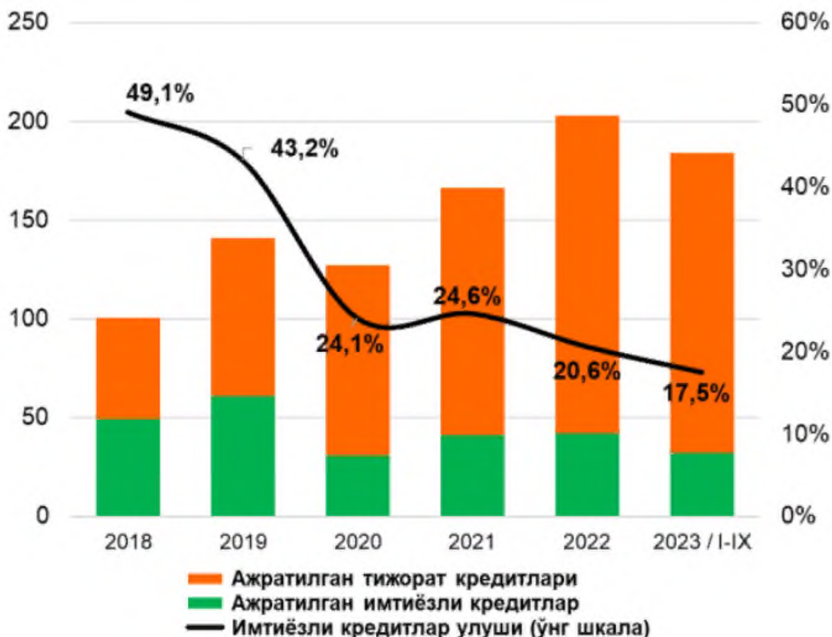
2-расм. Республикада тижорат банклари томонидан ажратилган кредитларда имтиёзли кредитлар улуши

Ҳозирги пайтда аҳоли турмуш даражасини яхшилаш, уларнинг кичик тадбиркорлик гоёларини қўллаб-қувватлаш ва инвестицион лойиҳаларни молиялаштириш мақсадида турли давлат дастурлари доирасида имтиёзли кредитлаш амалиётини босқичма-босқич бозор тамойилларига ўтказиш бўйича чоралар қўрилмоқда. Бу тадбирлар доирасида имтиёзли кредитларнинг улуши йилдан-йилга пасайиб бораётган бўлса ҳам, нисбатан юқориликча сақланиб қолмоқда. Хусусан, ажратилган жами кредитлар ҳажмида имтиёзли кредитлар улуши 2018 йилдаги 49,1 фоиздан жорий йилнинг дастлабки 9 ойида 17,5 фоизгача пасайган бўлса, имтиёзли кредитларнинг жами кредит қўйилмаларидаги улуши 2018 йил якунидаги 55,8 фоиздан жорий йил 1 октябрь ҳолатига 29,5 фоизгача қисқарган.