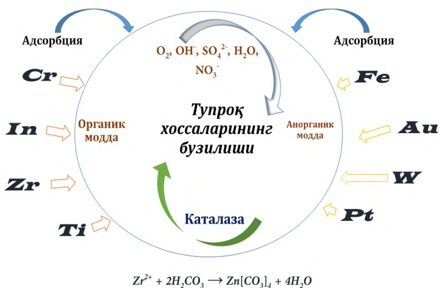
1-Расм. Оғир металлларнинг тупроққа таъсир механизми

Кўмирнинг морфологияси текширилганда элемент таркибида оғир металл ҳисобланган Вольфрам борлиги маълум бўлди. Кўмир таркибидаги вольфрамнинг миқдори 0.80% бўлиб, оғир металлнинг оз миқдори ҳам тупроқ, ўсимлик ва табиий экотизимга зарарли таъсир кўрсатади.