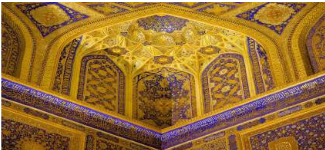
1-rasm. Ulug'bek madrasasi (Samarqand).

XIV-XV-asrlarda Samarqand hamda uning atrofidagi shahar va qishloqlarda milliy me'morligimizga oid turli-tuman inshootlar tez sur'atlar bilan qurila boshlandi. Mazkur qurilishlarda Hindiston, Eron, Iroq, Zakavkaze, xullas Amir Temur hukmronligi ostida bo'lgan barcha o'lkalardan kelgan me'morlar, hunarmandlar, ustalar, san'atkorlarni ko'rish mumkin edi. Ular o'zlari qurdirayotgan inshootlarga butun bilimlari, hunarlari va san'atkorona mahoratlarini baxsh etganliklari shubhasiz. Zero, o'sha davrlarda Samarqand va Movarounnahrning boshqa joylarida bunyod etilgan juda ko'p hashamatli tarixiy madaniy obidalarda O'rta Osiyo xalqlaridan tashqari butun yaqin va O'rta Sharq xalqlarining o'ziga xos boy, sermazmun badiiy-estetik merosining sintezi qorishib, uyg'unlashib ketganligi bilan dalilashimiz mumkin.