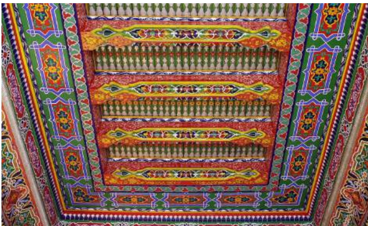
4-rasm. Bino intererining vassajuftlar bilan bezatilgan hovuzak qismi (Qo'qondagi Xudoyorxon o'rdasi).

Devorning friz qismi namoyonlar, manzaralar, katta-kichik naqshlar, unvonli yozuvlar va boshqalar bilan bezatilgan. Shuningdek, har xil geometrik va o'simliksimon naqshlar ishlangan. Devorning yuqori qismi bilan shift o'rtasidagi ganch bilan bezatilgan bejirim karnizlar ishlatilgan, buni sharafa deb ataladi. Shiftning o'rtasi o'yib ishlov berilgan yog'ochli yoki ganchli qubbalar bilan bezatilgan, bu esa hovuzak deyilgan (3, a-d-rasmlar). Shu va shu kabi hovuzaklarga islmiy, gulli girih yoki handasiy naqshlar, shuningdek, turunjlar bilan ziynatlangan. Shuningdek, xonaning hovuzaklariga silliq qilib vassajuftlar - yarim silindrsimon tayoqchalarni yonma-yon terib chiqish natijasida to'liqinsimon yuza hosil qilingan (4-rasm). Bunday hovuzaklar ko'pincha umumiy rang yoki oddiy islmiy naqsh bilan bezatilgan. Bu bezaklar o'zbek xonadonining ziynati hisoblangan.