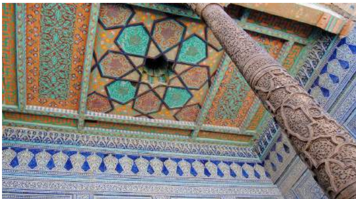
3, d-rasm. Bino ayvonining naqqoshlik san’ati bilan bezatilgan karniz va hovuzak qismi (Xivadagi Tosh hovli).

Shuni alohida ta’kidlash joizki, amaliy bezak san’atiga hamda tasviriy san’atga oid ko‘pgina san’at asarlari o‘zaro bo‘lib o‘tgan nizolar va urushlar oqibatida qasrlardagi, turar joylardagi, kutubxonalardagi va jamoat binolaridagi san’at asarlari bizgacha etib kelmagan. Ayrim qoldiqlarigina saqlanib qolingan. Ushbu topilmalarga asoslanib aytishimiz mumkinki, oppoq ganch ustidan chizilgan gullar, manzaralar, qushlar, mashvaratlar, shikorlar va jang ko‘rinishdari tasviri nihoyatda nafis ifodalangan.