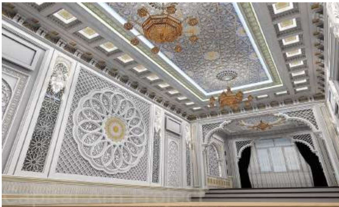
3, b-rasm. Bino intererining ganch o‘ymakorligi bilan bezatilgan friz va hovuzak qismi.

Shuni alohida ta’kidlash joizki, amaliy bezak san’atiga hamda tasviriy san’atga oid ko‘pgina san’at asarlari o‘zaro bo‘lib o‘tgan nizolar va urushlar oqibatida qasrlardagi, turar joylardagi, kutubxonalardagi va jamoat binolaridagi san’at asarlari bizgacha etib kelmagan. Ayrim qoldiqlarigina saqlanib qolingan. Ushbu topilmalarga asoslanib aytishimiz mumkinki, oppoq ganch ustidan chizilgan gullar, manzaralar, qushlar, mashvaratlar, shikorlar va jang ko‘rinishdari tasviri nihoyatda nafis ifodalangan.